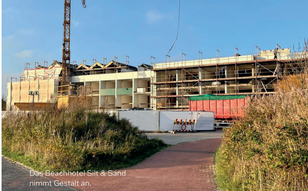
Das Beachhotel Silt & Sand nimmt Gestalt an.

Sie interessieren sich für die Investitionsmöglichkeiten? Kontaktieren Sie Jürgen Duhn von der Nord-Finanzierung GmbH unter Tel. (05921) 3083712 für weitere Informationen!